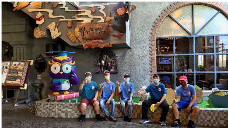
照片說明 (簡述): 111 年 9 月 26 日參訪彰化烘焙觀光工廠