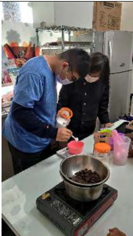
照片說明 (簡述): 烘焙課