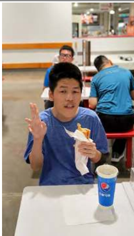
照片說明 (簡述): : 111 年 10 月 6 日好市多吃中餐