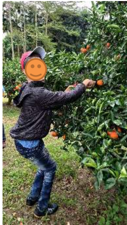
照片說明 (簡述): 111 年 12 月 5 日橘園採橘樂!