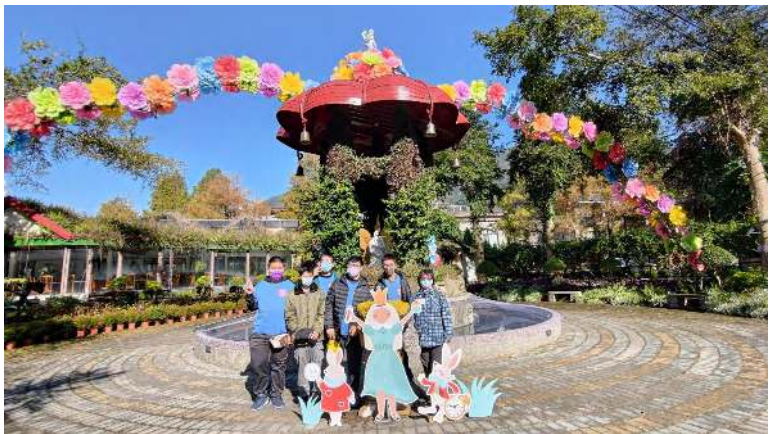
照片說明 (簡述): 111 年 12 月 26 日社區參與-台一農場