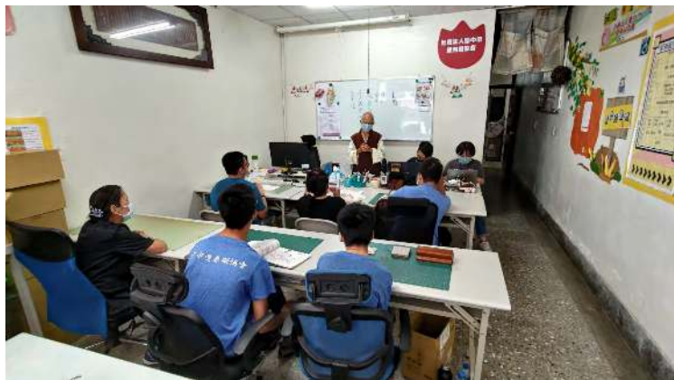
照片說明 (簡述): 樂活課程