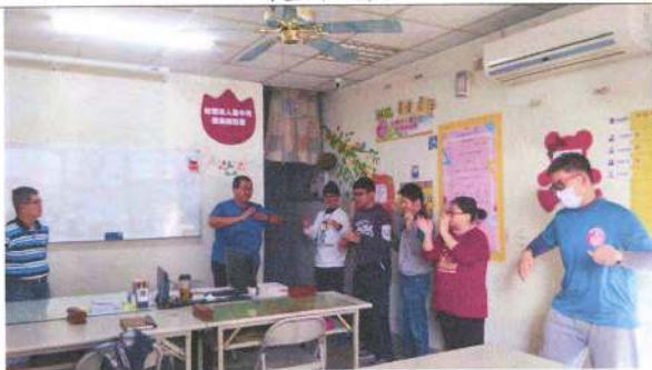
照片說明(簡述): 108年12月24日社團活動