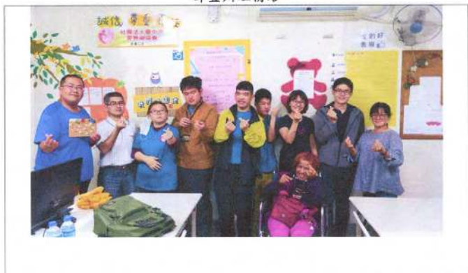
照片說明 (簡述): 108 年 11 月 18 日師生慶生會