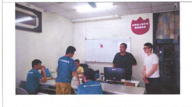
照片說明 (簡述): 108 年 11 月 1 日學生學習自我倡議