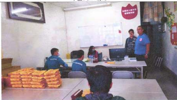
照片說明 (簡述)：：108 年 12 月 2 日學生自我介紹