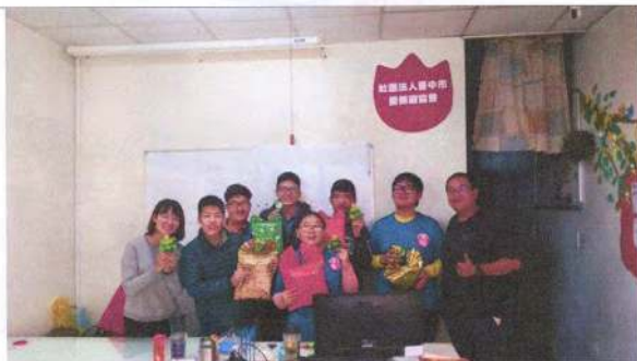
照片說明 (簡述): 108 年 12 月 25 日聖誕同樂活動