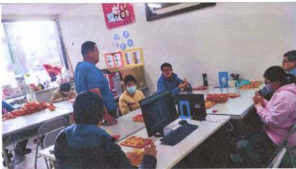
照片說明(簡述): : 108年12月6日作業活動