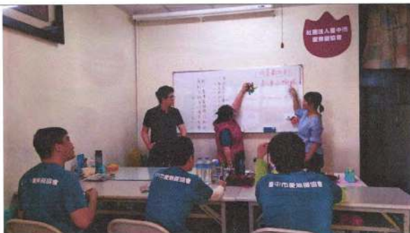
照片說明 (簡述)：108 年 11 月 25 日團體活動