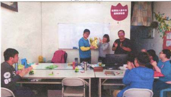
照片說明 (簡述): 108 年 12 月 25 日聖誕同樂活動